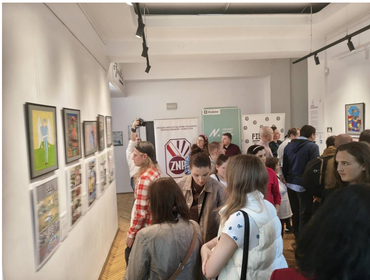
Na wernisażu FilmOn